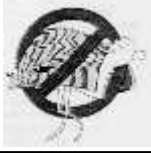
Foto 3, 4 y 5: Detalle de mejillón cebra en agregados. En el embalse de Ribarroja, en Fayón, 17 septiembre 2004