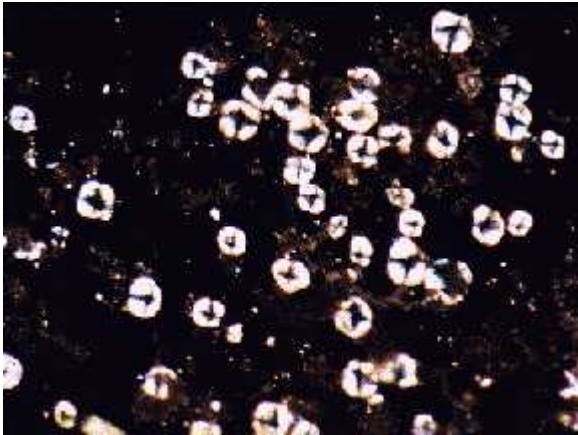
Visión de larvas mediante luz polarizada

Así, por medio de luz polarizada se puede distinguir la presencia de un tipo de zooplancton (ostracodos) así como la presencia de bivalvos. Los ostracodos pueden ser diferenciados examinando la forma de su concha. La concha de los ostracodos se caracteriza por su ornamentación (espinas) en la zona anterior y posterior. En muestras vivas, los ostracodos tienen brazos. Normalmente tienen forma de judía.