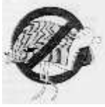
Foto 6: Detalle de mejillón cebra en una instalación que llevaba un mes en el agua