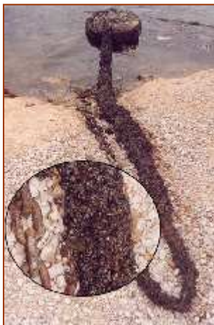
Mejillones cebra fijados a una cadena del embarcadero de Fayón (Zaragoza)

El mejillón cebra es un molusco bivalvo que puede alcanzar unos 3 cm de longitud (generalmente es más pequeño) y con un aspecto similar a los mejillones marinos. Suele vivir unos 3 años. La temperatura mínima para sobrevivir los adultos es 0°C, para alimentarse 5°C, para crecer 10°C y para reproducirse 12°C. Experimentalmente se ha encontrado que el límite de temperatura superior para sobrevivir es de 30-32°C. La filtración se da en un rango comprendido entre 5-30°C y a un pH entre 8-9. Esta especie también destaca por su alta tolerancia a variaciones de salinidad y temperatura, incluso resiste varios días fuera del agua (entre 5 y 6 días a la exposición al aire) lo cual ha permitido su dispersión a partir de individuos fijados en cascos de embarcaciones o en bodegas de cargueros, si bien las grandes