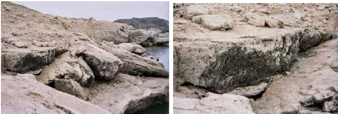
Foto 9: Detalle de las poblaciones de mejillón cebra en una instalación sacada del embalse de Mequinenza. Agosto 2005.