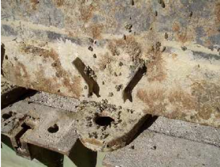
Foto 7 Y 8: Mejillón cebra en las laderas del embalse de Mequinenza. Agosto 2005.